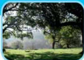
Réserve Naturelle de la Massane