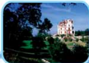
Le Parc de Valmy